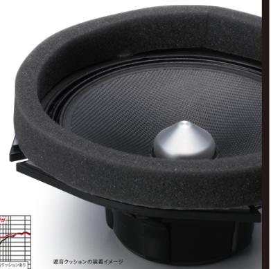
遮音クッションの装着イメージ